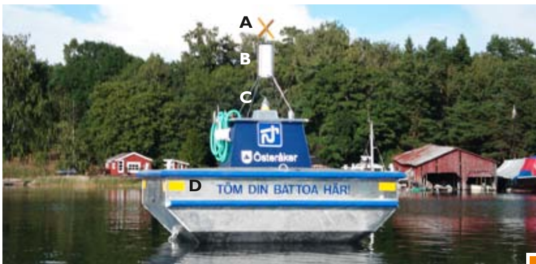
A: Gult kryss i fluorescerande (självlysande) färg. B: Radarreflektor. C: Gult blyxtljus med karaktären FI Y 3s 3 M. D: Gula reflexer.

Tömningsstationen för toalettavfall utrustas normalt sett med de SSA som visas på bilden: